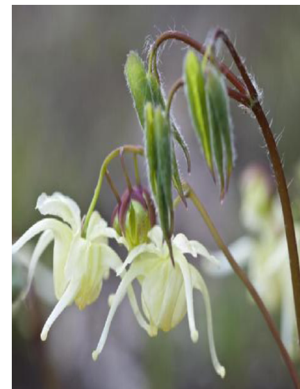
Elfenblume Staude des Jahres 2014